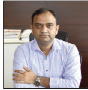
सप्ताह भर होंगी विभिन्न गतिविधियां आयोजित