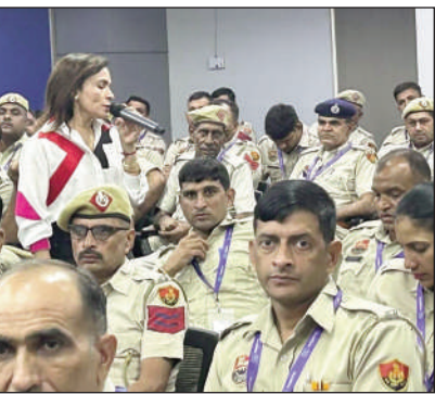
सहित करीब 200 पुलिस कर्मचारी शामिल हुए। इस कार्यक्रम के माध्यम से उपस्थित पुलिसकर्मियों को फोन कॉल प्राप्त हो तो कैसे बात करनी है, किसी इमरजेंसी में फोन कॉल प्राप्त करने के लिए पुलिसकर्मियों को कैसे बात करनी है, किसी पीडित महिला या विपक्षी महिला के साथ किस तरह से बात करें, गलत व्यवहार करने पर किस तरह से बात करें तथा बातचीत करते समय व्यक्ति, महिला, बुजुर्ग व बुजुर्ग महिलाओं को क्या कहकर सम्बन्धित करें इत्यादि बारे में बताया गया।

गुरुग्राम। आमजन के साथ बेहतर कम्युनिकेशन बनाने के लिए पुलिस पीसीआर व ईआरवी पर तैनात पुलिसकर्मियों को साफ्ट स्किल ट्रेनिंग दी गई।