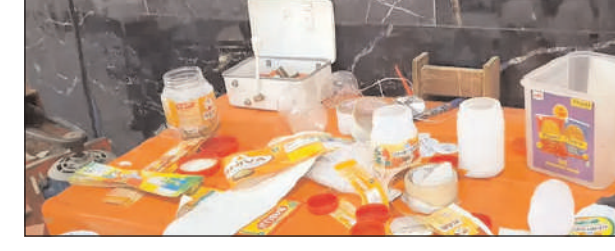
भेजा गया है। जानकारी के अनुसार टीम को गुप्त सूचना मिली थी कि गांव

रेपर जब्त किए। मौके पर टीम को खराब घी भी मिली, जिसे नष्ट करवाया गया। इसके इस्तेमाल से सैपल लेकर जांच के लिए भेजे गए। सीएम फ्लाईंग, फूड सेफ्टी अधिकारी एवं गुप्तचर विभाग कर्मचारियों ने एक घी फैक्ट्री पर रेड की। उसने जांच के दौरान टीम ने करीब 2400 किग्रा.गाम घी बरामद किया। इनके डिब्बों पर विभिन्न कंपनियों के रेपर लगे हुए थे। घी के सैपल जांच के लिए लेब में