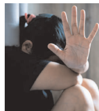
उसे देह व्यापार करवाया जाने लगा। करीब चार माह से वह जन्म सहन कर रही थी।

करीब और भेड़ियों को बेच दिया करते। मासूम के साथ इस प्रकार चार माह तक दुकर्म करवाया गया। मासूम ने काफी सहने के बाद इसकी शिकायत महिला थाने में बताया। इसमें अपने सौतेले पिता पर भी दुकर्म का आरोप लगाया है। पुलिस ने मामले में मुकदमा दर्ज करके अपनी जांच शुरू कर दी है। पीड़िता ने अपनी शिकायत में बताया कि जब वह बेहोश हो जाती तो माता-पिता ग्राहक के उसे पेश करते जो उसके साथ दुकर्म करते। यही नहीं निर्दयी पिता भी उसके साथ दुकर्म करता था। बताया गया कि अक्सर पिता उसके साथ छेड़खानी कर रहा रहता था। मौका पाते ही नशीला पदार्थ देकर बेहोश कर दिया