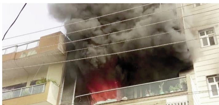
नुकसान हो गया। प्रारंभिक जांच में आग लगने की वजह शॉर्ट सर्किट बताई जा रही है।

गुरुग्राम। सैक्टर 7 के एक मकान में आग लगने से हड़कंप मच गया। प्राप्त जानकारी के अनुसार बुधवार प्रातः सैक्टर 7 स्थित एक मकान की दूसरी मंजिल पर आग लगने के कारण दोनों महिलाओं ने शोर मचा दिया। एक महिला तो भागने में कामयाब रही, जबकि दूसरी महिला कमरे में फंस गई थी। मौके पर पहुंची 4 फायरब्रिगेड की गाड़ियों ने बड़ी मशकत के बाद आग पर काबू पाया और महिला को सफुशल बाहर निकाला। बताया जाता है कि आग इतनी भयंकर थी कि दूसरी मंजिल पर आग लगने के कारण तीसरी व चौथे फ्लैट पर भी काफी