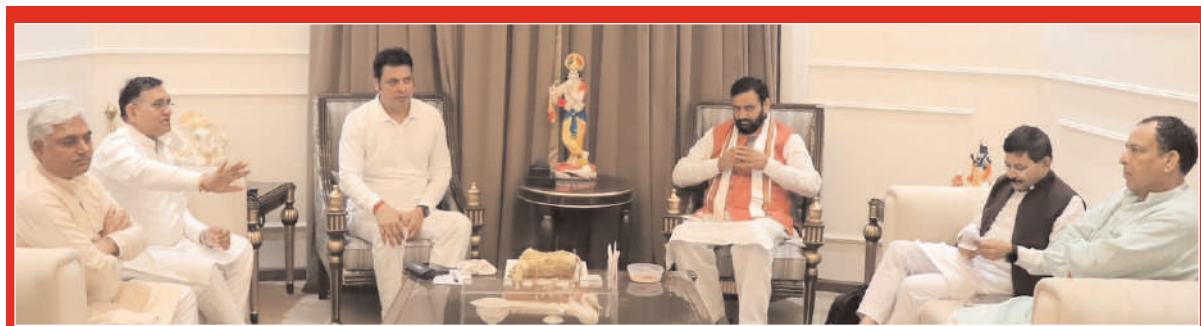
त्रिपुरा के पूर्व मुख्यमंत्री, प्रदेश भाजपा प्रभारी व सांसद बिलाल कुमार देब के दिल्ली आवास पर हरियाणा भाजपा के नवनियुक्त प्रदेश अध्यक्ष नायब सिंह सैनी की अध्यक्षता एवं प्रदेश संगठन महामंत्री फनीन्द्रनाथ शर्मा की उपस्थिति में आयोजित संगठनात्मक बैठक में पार्टी की आगामी गतिविधियों, संगठनात्मक विषयों एवं कार्ययोजना के संदर्भ में विस्तृत चर्चा हुई। इस दौरान प्रदेश के महामंत्री भी उपस्थित रहे।

ने योजनाओं को लोगों तक पहुंचाया। केंद्र की योजना का हरियाणा को लाभ मिलना है। केंद्र और राज्य सरकार ने मिलकर काम किया। अगर दिल्ली से 100 पहुंचते हैं तो मुख्यमंत्री सवा सौ करके लोगों तक पहुंचाते हैं।