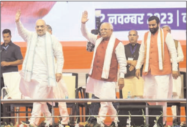
इससे पहले 10 सालों में केवल 40 हजार करोड़ रुपए दिए गए

चंडीगढ़। केन्द्रीय गृह एवं सहकारिता मंत्री अमित शाह ने हरियाणा के मुख्यमंत्री मनोहर लाल की तारीफ करते हुए कहा कि उन्होंने हरियाणा से भ्रष्टाचार, भाई-भतीजावाद व क्षेत्रवाद की राजनीति को खत्म किया है। विकास कार्यों के लिए केन्द्र सरकार की ओर से हरियाणा प्रदेश को पिछले 9 वर्षों में 1 लाख 32 हजार करोड़ रुपए की राशि उपलब्ध करवाई गई है जबकि इससे पहले कांग्रेस के 10 सालों के कार्यकाल में केवल 40 हजार करोड़ रुपए की राशि उपलब्ध करवाई गई। वह