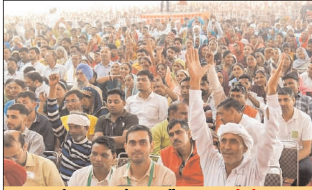
मनोहर लाल के कार्यों पर लगाई मोहर

आज हरियाणा गठन के 57 वर्ष पूरे होने पर दानवीर कर्ण की नगरी करनाल में आयोजित अंत्योदय महासम्मेलन में मुख्य अतिथि के रूप में संबोधित कर रहे थे। हरियाणा की पावन भरती को