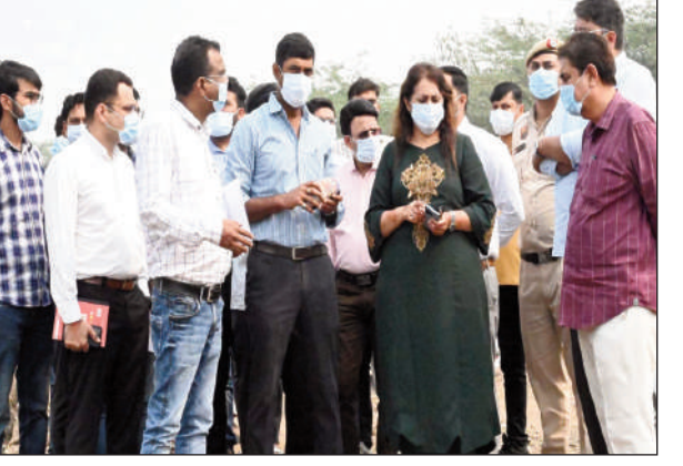
और अधिक तेजी लाने के निर्देश दिए। बैठक में बताया गया कि लीगेसी कचरे का निष्पादन करने के बाद उससे निकलने वाले आरडीएफ को एजेंसियों द्वारा सीमेंट कंपनियों में भेजा जाता है, जबकि खाद व इन्ट का डिस्पॉजिट भी एजेंसियां अपने स्तर पर भी कर रही हैं। बैठक में लीचेट के बारे में बताया गया कि कचरे से निकलने वाले लीचेट को गुरुग्राम के सीवरेज ट्रीटमेंट प्लांटों में भेजा जाता है, जहां पर इस्का ट्रीटमेंट होता है। इसके अलावा, नगर निगम गुरुग्राम क्षेत्र में निकलने वाले फेश कचरे में से 370 टन कचरे का निष्पादन प्रतिदिन ऑनसाईट किया जाता है।

एम्के अरोड़ा, भरोसा मित्र गुरुग्राम। नगर निगम फरीदाबाद की आयुक्त ए. मोना श्रीनिवास वीरवार को गुरुग्राम-फरीदाबाद रोड़ पर स्थित बंधवाड़ी कचरा निष्पादन साईट पर पहुंचीं। उन्होंने यहां पर दोना नगर निगमों के अधिकारियों तथा कचरा निष्पादन का कार्य करने वाली एजेंसियों के साथ बैठक की तथा उन्हें निष्पादन कार्य में तेजी लाने के निर्देश दिए। बैठक में अधिकारियों ने बताया कि लीगेसी कचरे के निष्पादन के लिए मौजूदा समय में 4 एजेंसियां कार्य कर रही हैं तथा 5-5 लाख टन कचरे का निष्पादन करने के लिए तीन अन्य एजेंसियों को कार्य सौंपा जाना है। बंधवाड़ी साईट पर अब तक लगभग 20 लाख टन लीगेसी कचरे का निष्पादन किया जा चुका है तथा शेष बचे कचरे का निष्पादन भी अप्रैल 2024 तक कर लिया जाएगा। निगमायुक्त ने लीगेसी वेस्ट निष्पादन का कार्य कर रही एजेंसियों को कार्य में