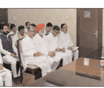
हरियाणा के हैपीनेस इंडेक्स को बढ़ाना सरकार का लक्ष्य

शशिभूषण सैनी, भरोसा मित्र चंडीगढ़। मुख्यमंत्री मनोहर लाल ने कहा कि वर्तमान राज्य सरकार गरीब व जरूरतमंदों कल्याणार्थ योजनाएं क्रियान्वित कर रही है। हमने पॉक में खड़े अतिम व्यक्तियों को योजनाओं का लाभ देने की शुरुआत की है, ताकि वे मुख्यधारा में आकर समाज का हिस्सा बन सकें। सरकार ने गरीब व जरूरतमंदों को समय पर सहायता देकर उनके जीवन को सरलभान किया है। अब वे गर्व से कह रहे हैं कि वे भी समाज के अभिन्न अंग हैं और उनके अधिकारों को कोई दबंग नहीं छीन सकता है। मुख्यमंत्री आज चंडीगढ़ में अपने निवास संत कबीर कुटीर पर हिसार, सिरसा और फतेहाबाद जिलों के