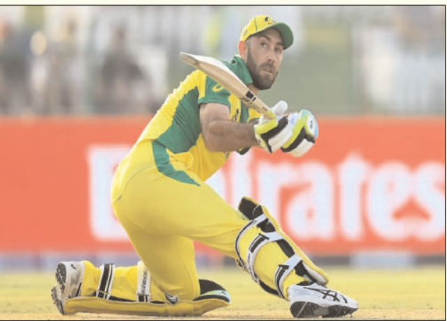
ओवर में 5 विकेट पर 291 रन बनाए। ओपनर इब्राहिम जादरान ने 129 रन की नाटआउट पारी खेली। 292 रन का टारगेट ऑस्ट्रेलिया ने 46.5 ओवर में 7 विकेट खोकर हासिल कर लिया। टीम से ग्लेन मैक्सवेल ने संजुयी लगाई।

वानखेड़े में अफगानिस्तान और ऑस्ट्रेलिया विश्व कप मैच के दौरान क्रिकेट फेस ने मंगलवार को एक क्रिकेटर का अविश्वसनीय साहस देखा। ग्लेन मैक्सवेल की 201 रन की अविजित पारी। चोट लगी, दो-दो बार फीजीजों को आर, रन लेने में दिक्कत आ रही थी पर मैक्सवेल न रुके ना थके। 8वें विकेट के लिए 202 रन की साझेदारी की और 292 का टारगेट हासिल कर लिया। मैक्सवेल की इस साहसिक पारी से ऑस्ट्रेलिया ने अफगानिस्तान को 3 विकेट से हराया। टीम ने 91 रन पर 7 विकेट गंवा दिए थे। यहां से मैक्सवेल ने कमिंस के साथ 8वें विकेट के लिए नाबाद 201 रन की रिकार्ड साझेदारी करके सबसे बे 1 रन चेज किया। वानखेड़े स्टेडियम में अफगानिस्तान ने टॉस जीतकर बैटिंग चुनी, टीम ने 50